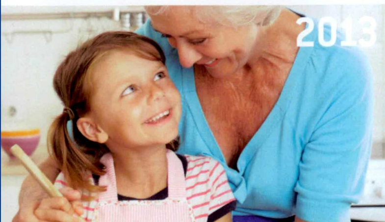
tijd voor elkaar