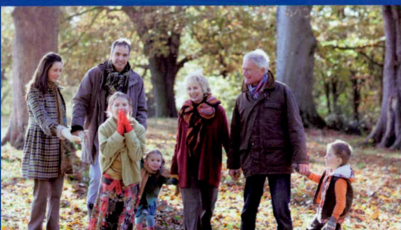
tijd voor anderen