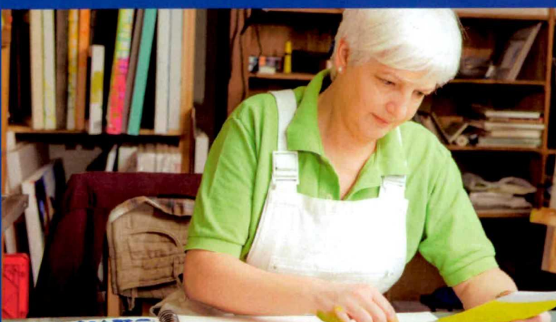
tijd voor jezelf