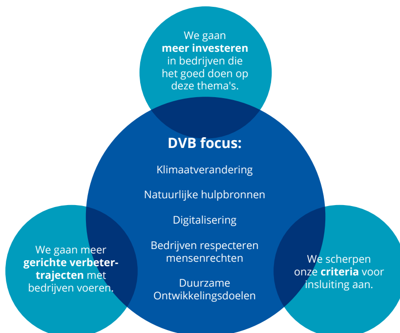
Figuur 1: Waar we op inzetten binnen de transities

We leven niet in een perfecte wereld. We kunnen als pensioenfonds een belangrijke rol spelen maar zijn ook afhankelijk van anderen en de wereld om ons heen. We zijn daarom ambitieus, maar ook realistisch. Bij de implementatie van het DVB-beleid houden we dus rekening met de snelheid van de transities en de regionale